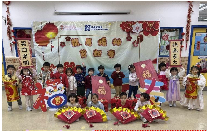
幼兒穿上美麗的華服慶祝新年。