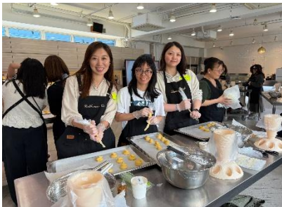
手語共融烘焙工作坊