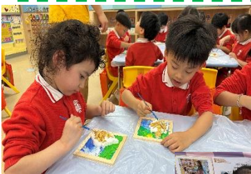
K3 香港非遺客家麒麟與海陸豐麒麟