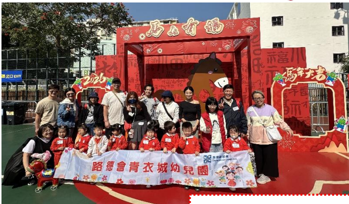
家長和小朋友一起逛年宵，感受農曆新年的氣氛