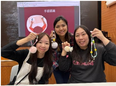
手語手工共融工作坊