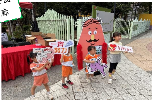
青衣東北公園 及海濱長廊