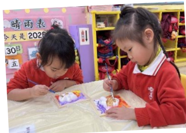
K2 香港非遺醒獅與我