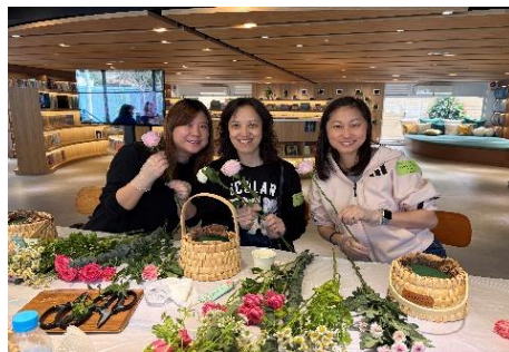
手語共融花藝工作坊