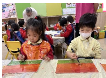
K2 大自然的美麗空間